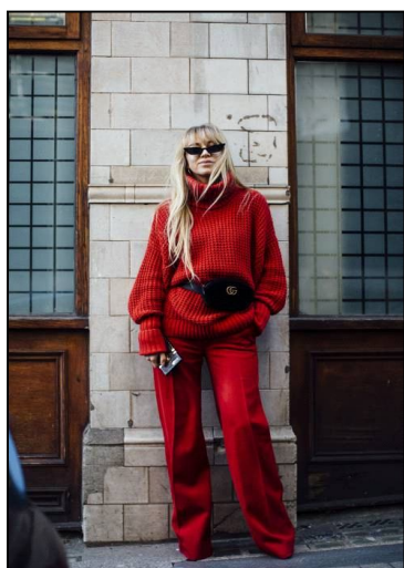
Kreacja przyciągająca uwagę – odważna czerwień.

Tej jesieni szczególną uwagę mają przykuwać kolory. Musztardowy, khaki, zielony, intensywny fiolet, czy liliowy oraz ciągle czerwień, to kolory uważane za te najmodniejsze na jesień tego roku. Nie zapominajmy o bieli i beżach, bo także będą ważnymi kolorami w tym sezonie. Krata, pasy i motywy zwierzęce to hity, które spokojnie możesz wyjąć ze swojej szafy.