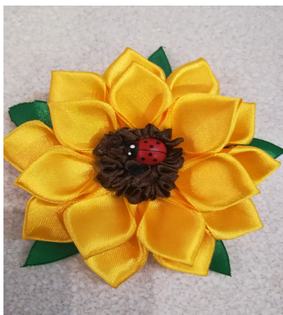
Takie piękne słoneczniki – broszki otrzymali nauczyciele oraz pracownicy szkoły z okazji DEN.